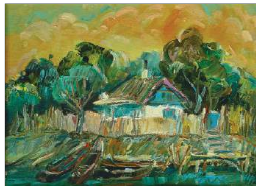
Vasile Buz – Vară târzie

În minutele următoare, bunica și frumușica nepoată pozară neexperimentate pe fundalul unui gard, în timp ce Gaborean se trase trei pași în spate și le făcu două-trei cadre. Palma dreaptă a femeii mai în vârstă, crăpată dar cu degete fine, prinse cu neîndemănare mâna stângă a fetei, iar obrazul stâng al bunicii dădu să se apropie de obrazul drept al puștoacei, deja mai înalte. La început, nepoata avu o ușoară reacție de refuz; dar acceptă în cele din urmă, obrații celor două se alăturară ca semn al nesfârșitei povești de dragoste dintre bunici și nepoți, astfel încât ar fi fost foarte probabil ca această fotografie să rămână drept una dintre cele mai frumoase din istoria de secol XX a satului Nazarcea.