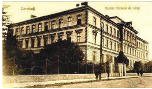
Liceul din Cernăuți în care a învățat Mihai Eminescu