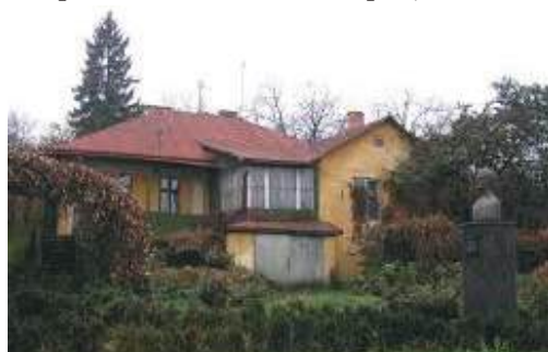
Casa lui Aron Pumnul din Cernăuți

Aron Pumnul, avea două case proprii la periferia orașului, una dintre acestea o închiria, de obicei, elevilor. „Cum ajungeai la porțița de lemn a casei, lângă un stejar rămușor, era o fântână iar cele două case te întâmpinau numaidecât... Cea din mâna dreaptă, așezată pe o temelie din piatră, cu acoperământul de draniță, în patru ape, cu un foișor în centru, din față și cu gang împrejur, cu o scară de piatră și balustradă de fier forjat, îi servea stăpânului pentru munca lui zilnică asupra cărților și pentru odihna trupului său slăbit înainte de vreme, iar căsoaia din stânga – din două aripi, unite la un loc, într-un unghi drept, scufundată puțin în pământ, era rezervată de obicei pentru tinerii învățăcei săraci, pe care îi ținea în gazdă. Tot aici se afla și o mică bibliotecă a gimnaștilor români, care trecea în ochii lumii și mai ales ai direcției de la gimnaziu de proprietate personală a profesorului, căci regulamentul școlar austriac de pe atunci nu prevedea ca elevii să țină biblioteci particulare...” (Mihai Prepelită, Ucenic la